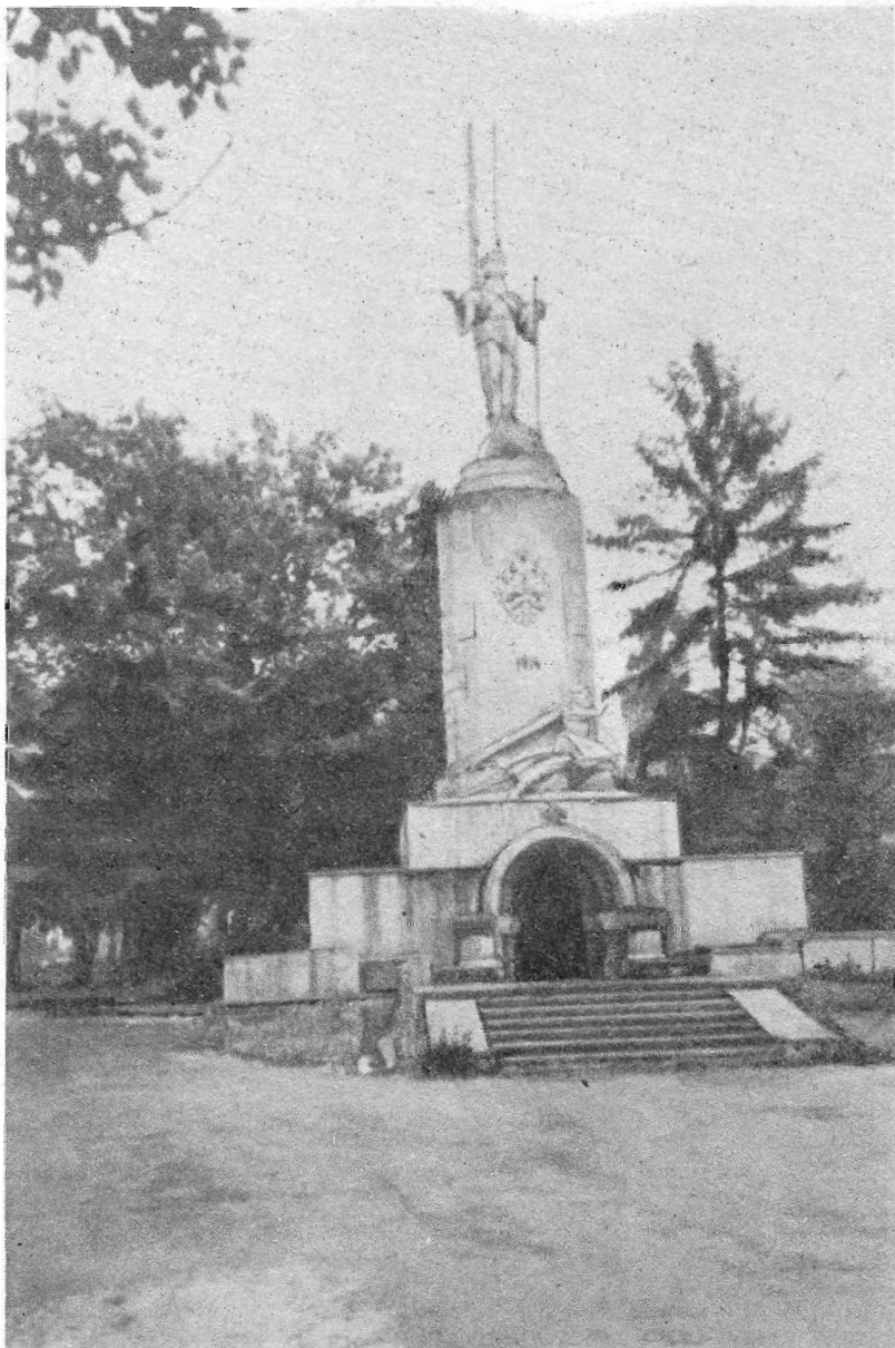
Рис. 3. Памятник Николаю II и русским воинам 1914—1918 гг.

белогвардейский верховный главнокомандующий. Врангель скончался в 1928 г. в Брюсселе (Бельгия), но по завещанию его прах в 1929 г. был перенесен в Белград в русскую церковь. Вскоре русскую церковь заслонил воздвигнутый монументальный сербский собор Св. Марка, который поглотил и одноименную небольшую церковь, где покоились убитые в 1903 г. во время заговора король Александр Обренович и королева Драга [1, с. 23—29].