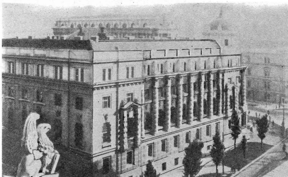
Рис. 5. Министерство финансов