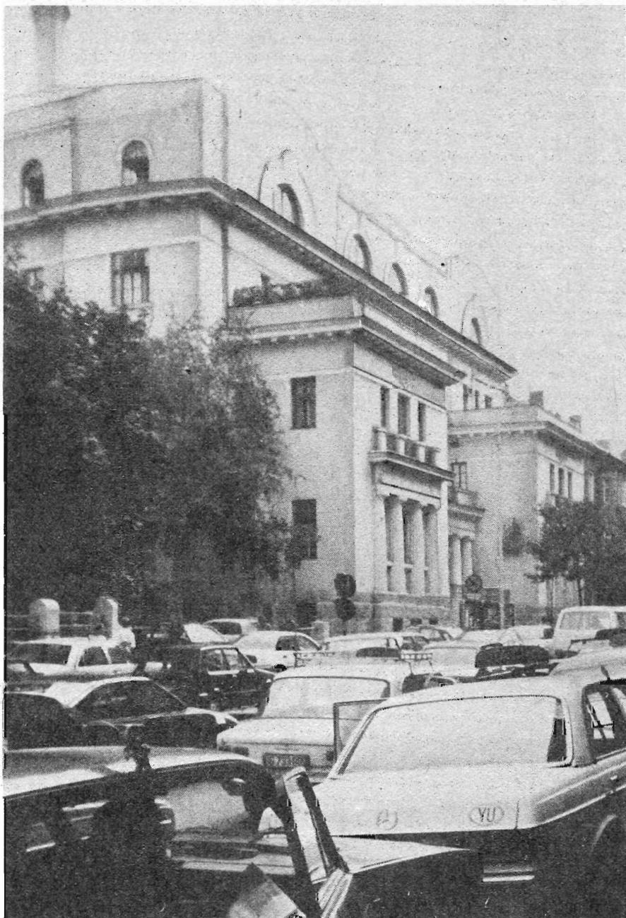
Рис. 4. Русский дом

история. Каждый год в период между двумя войнами представители государств Антанты, объединившиеся в организацию Фидак, служили панихиды, возлагали венки, отдавали воинские почести и исполняли государственные гимны на всех союзнических военных кладбищах. И только перед памятником Русской славы, в первый год после его постройки, венки были возложены без всяких почестей. После этого организацию Фидак к памятнику перестали