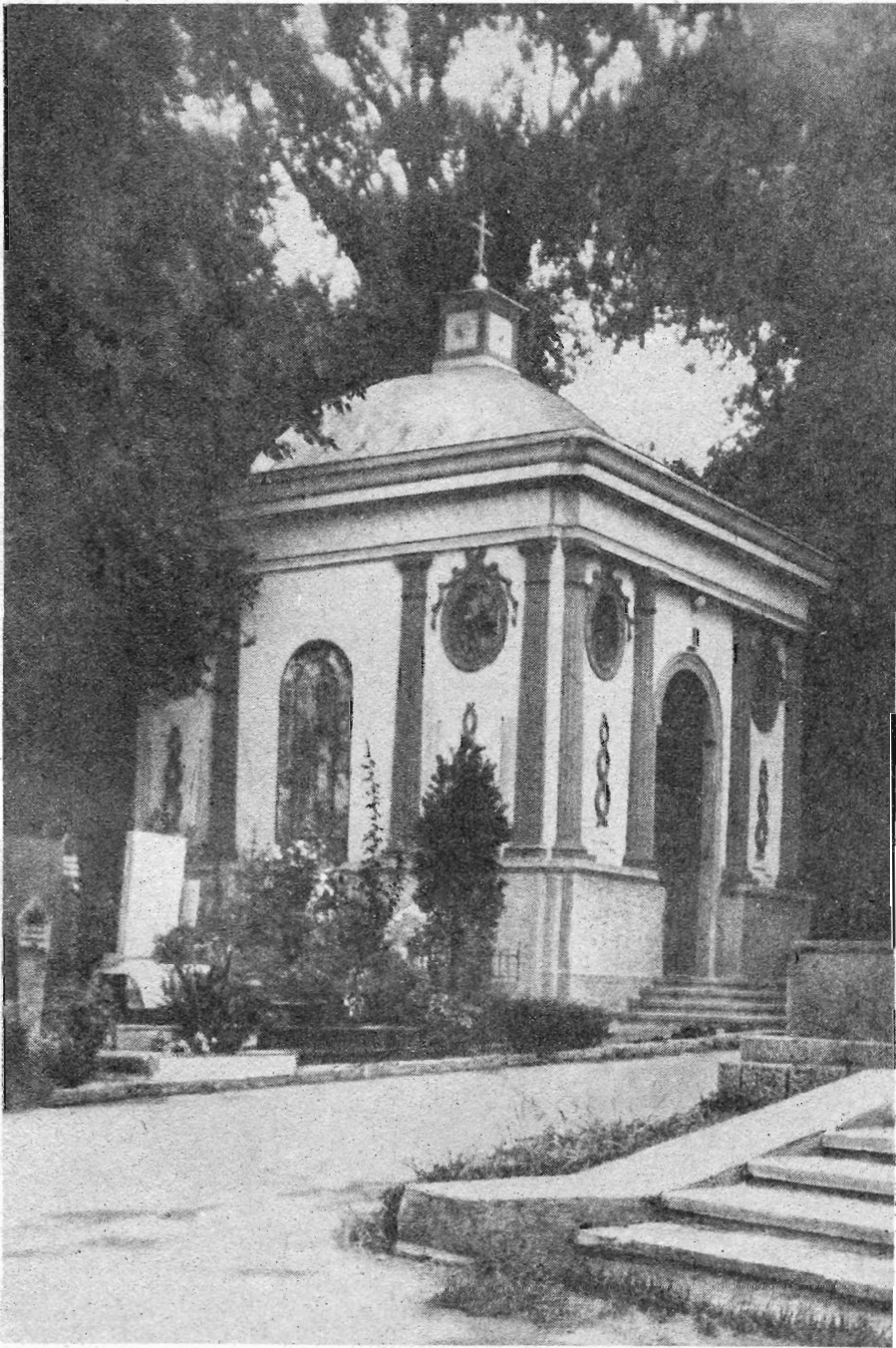
Рис. 2. Иверская часовня

Богоматери. Церковь Св. Троицы стала кафедральным собором иерарха Русской православной зарубежной церкви, бывшего митрополита киевского и галицкого Антония (А. П. Храповицкого). В этом храме хранились знамена и штандарты старых полков российской армии. Здесь в мраморной гробнице, справа от главного входа похоронен генерал, барон П. Н. Врангель — последний