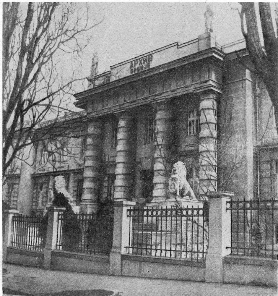
Рис. 6.